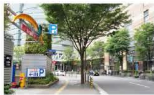
▲②ワシントンホテル向かい側入り口

キャナルシティ博多に駐車場は5F～8Fの地上駐車場と、B2Fの地下駐車場があります。当ホテルにご宿泊のお客様は、B2F地下駐車場、 E のエリアが便利です。