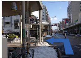
②交差点を左折します。