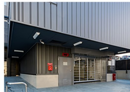
⑥当ホテルの立体駐車場に到着です。

〒030-0801 青森県青森市新町1-11-16 [TEL]017-732-7380