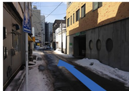
⑤左折後、直進します。