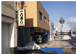
④一八寿司の看板が見えたら、一方通行を左折します。