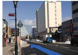
③アスパム通りを直進します。