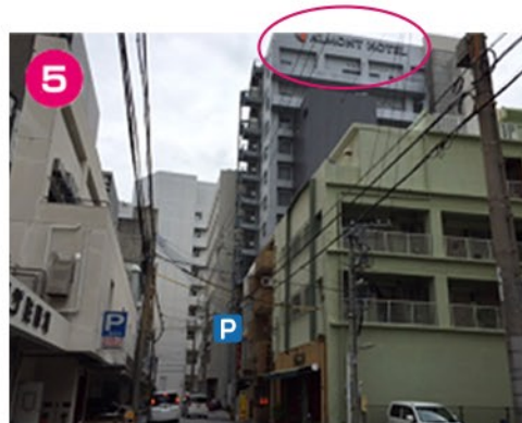
⑤右側のPマークが目印です。 右上をご覧頂くとホテル看板が見えます。