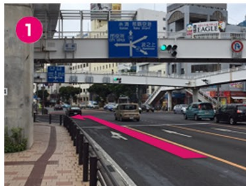
①58号線を南下し、泉崎交差点を左折。