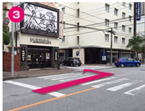
③左手の紅虎餃子房を左折。