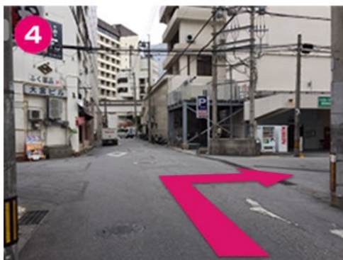
④一つ目の交差点を右折。